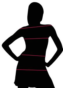
TABELLE TAGLIE E CORRISPONDENZE